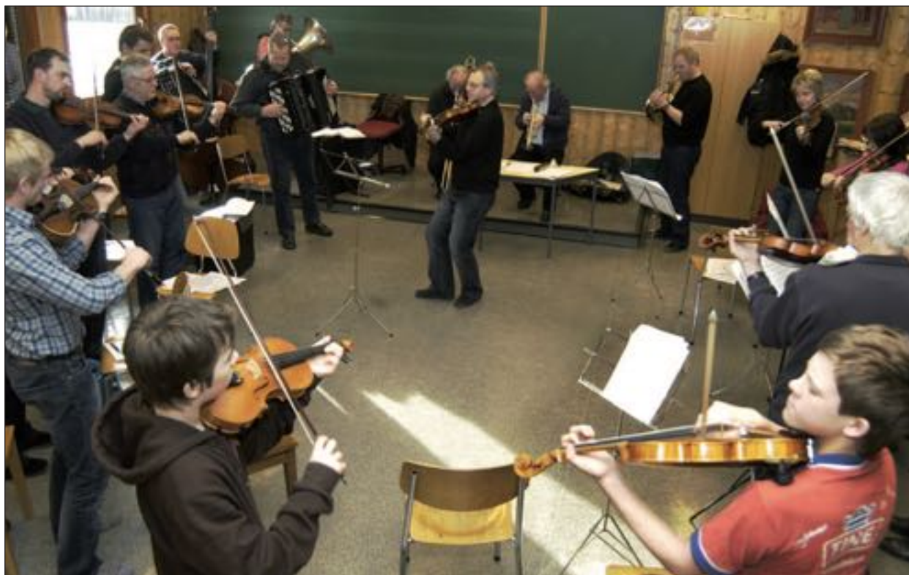
Samarbeidet mellom Vågå Spelmanslag og Brazz Brothers har vore ein stor suksess. Her under øving i Vågå.