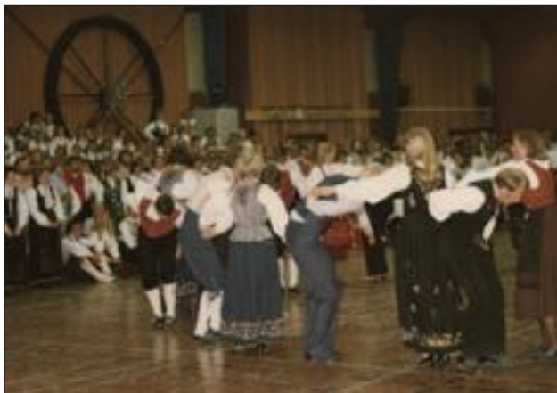
Frå NU-stemna i Skjåk 1982.

Spelmennene pratar om leikje og slåtte. Leik og slått tyder om lag det same, men det er ikkje like vanleg å bruke slått om runddansleikje som masurka, reinlender, nyare skotske, galopp, polka og valsar. Slått blir helst brukt om halling, marsj og springleik - og i nyare tid om lyarslåttar.