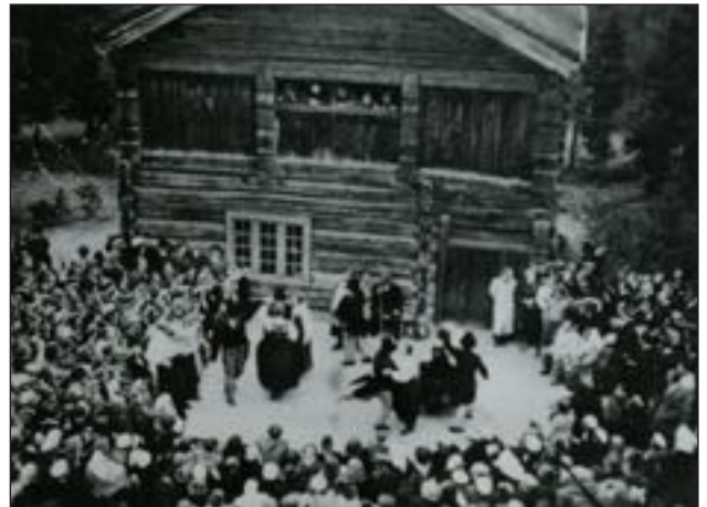
Ungdomsstemne i Lom 1947. Dans i Presthaugen.

Så fekk eg sjå kår ho Kari sto, ho Kari sto Ho sto ved grinde og lokka grisin mange Med silkjesokke og beksåmsko, og beksåmsko Slør og trøye og samlebok onde arme /:Å grisen han krulla rompa og sprang, heinn/: Suram-suram-suram-suram-suradlu-rei Suram-suram-sadl-adlu-ramsadl-o.