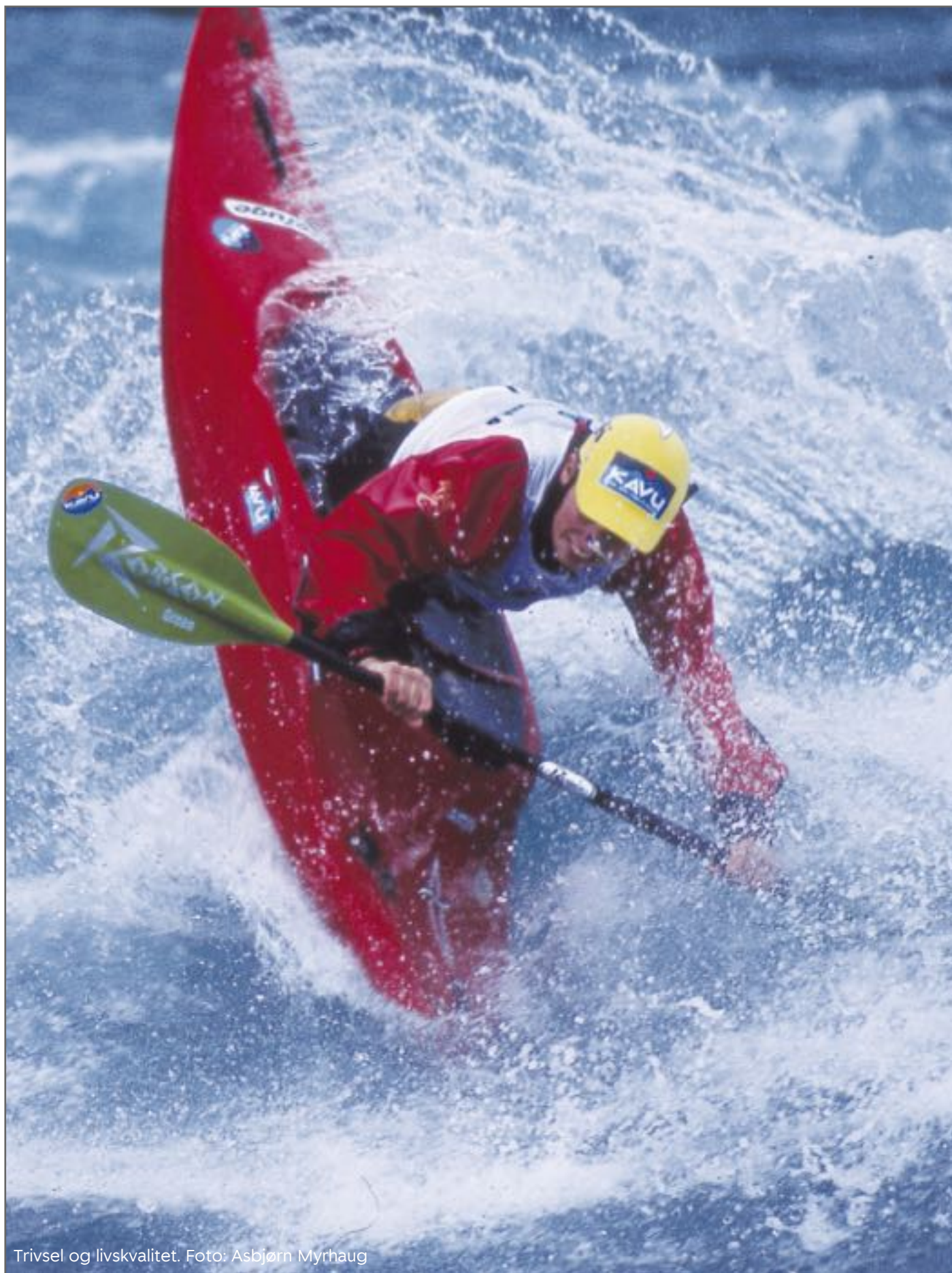
Trivsel og livskvalitet.