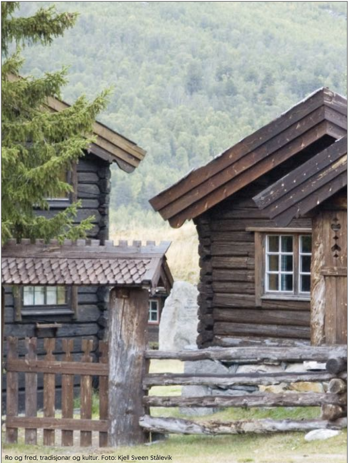
Ro og fred, tradisjonar og kultur.