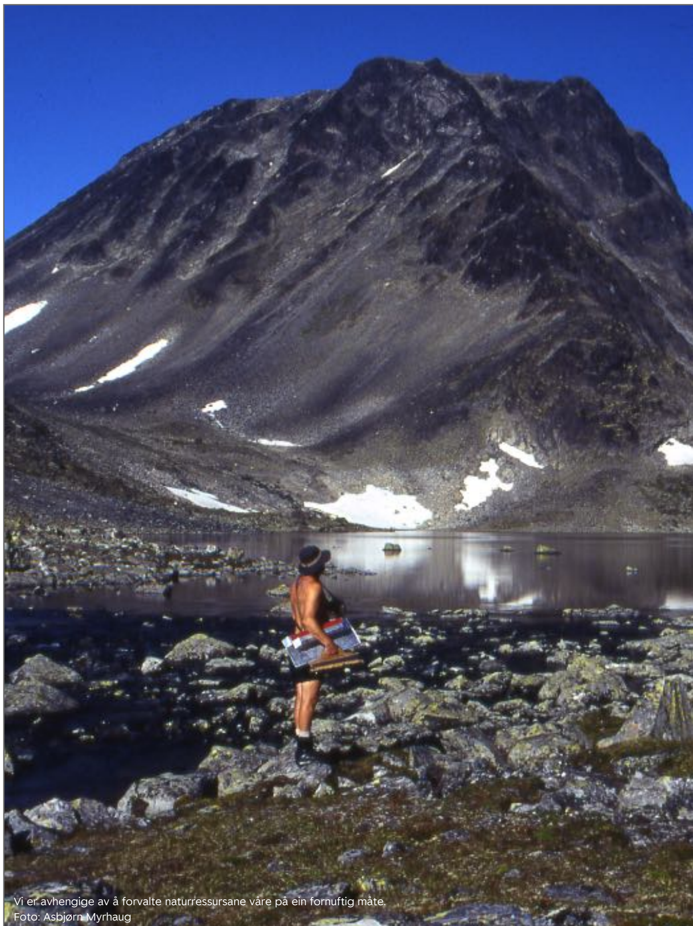
Vi er avhengige av å forvalte naturressursane våre på ein fornuftig måte.