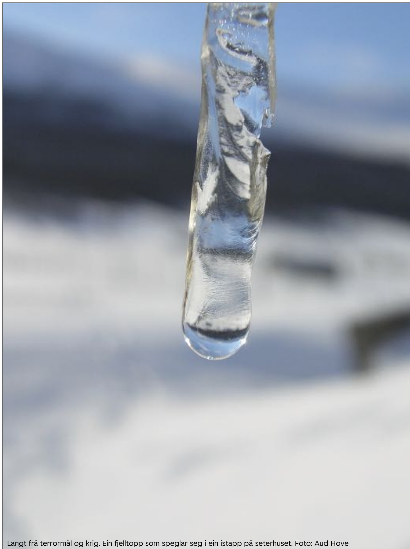
Langt frå terrormål og krig. Ein fjelltopp som speglar seg i ein istapp på seterhuset.