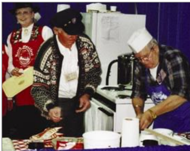
God, gamaldags kjøtsuppe og vaflar står sjølsagt på menyen under haustfesten i Minot.