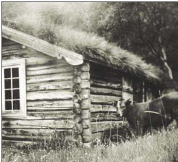
Aasastugu på Skjelden. Røysheim-Skjelden var husmannsplass på Røysheimåsen.