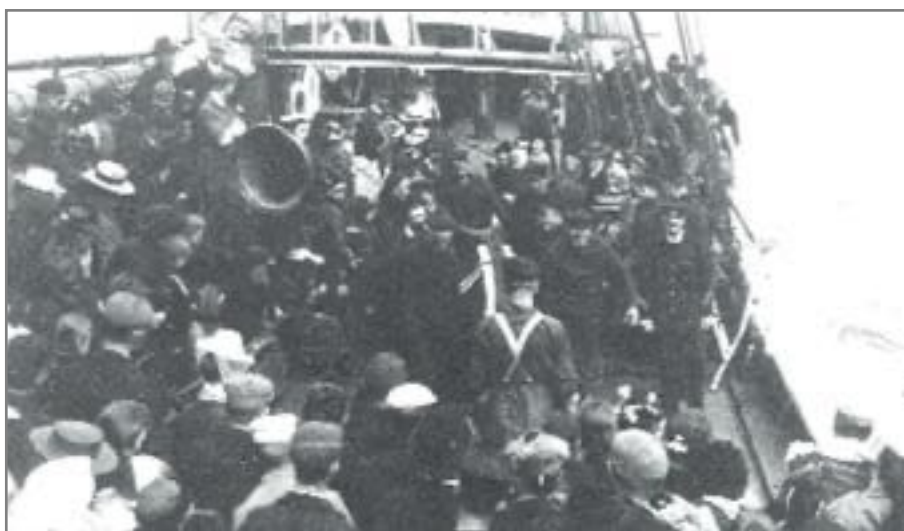
Ikkje alle nådde fram til Amerika. Mange døyddde på overfarten og fekk si grav i havet. Begravelses-sermonien på bildet er frå skipet “Norge”. Skipet, som seinare skulle forlise, står det meir om lenger ut i temadelen.

tidlegare. På turar med hard sjø kunne storparten av passasjer-ande bli liggjande sjøsjuke utan å vere i stand til å gjera noko som helst. Knut Hamsun skreiv i ein artikkel frå 1886 om si andre amerikareise. Her skildra han kor sjuk både han sjølv og dei andre om bord vart da stormen møtte dei på ope hav. Ein mann skal ha sagt til han at dersom han nokon gong kom på land att, skulle han aldri bry seg om slike bagatellar som å miste ein finger eller ein fot.