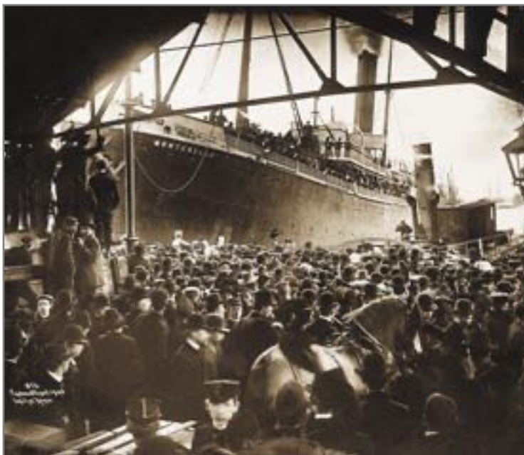
“Montebello” legg til kai i Bjørvika 1903. På dekket står dei verdensvante som skal heim til Norge på besøk eller kanskje for godt. På kaia mange som kanskje står på norsk jord for siste gong.

Utvandringa var på fleire måtar ei redning for dei som vart att i bygdene i Ottadalen. Samstundes var det ofte dei unge og mest arbeidsame som reiste, noko som nærmast for-gubba Ottadalen. Det var også langt fleire menn enn kvinner som reiste, slik at det vart kvinneo-verskot i dalen. Til dømes var det i 1900 berre 81,2 menn pr. 100 kvinner i Lom mot 97,6 pr. 100 i 1835 – før utvandringa sette i gang for fullt.