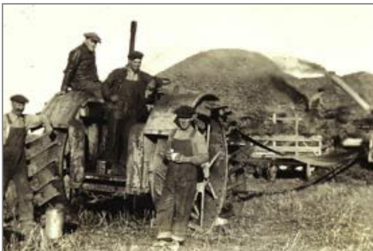
Tresking på ein farm i Adler Township i 20-åra.