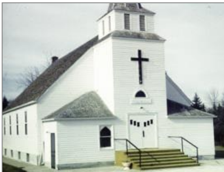
Lom Lutheran Church.