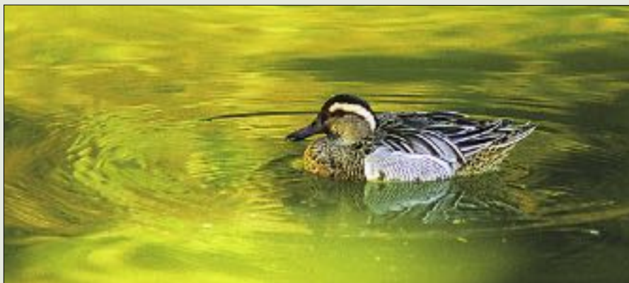
Knekkand - ein sjeldan gjest på Åsjo

Fuglelivet er langt frå statistisk. Det endrar seg over tid av kjende og ukjende årsaker. Det finst og døme på at artar aukar i tal.