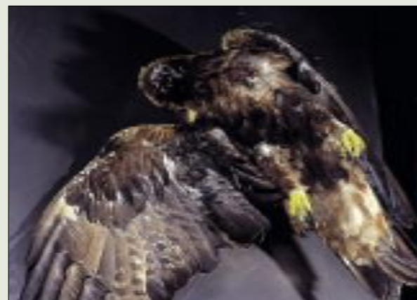
Kongeørn fotografert på Norsk Fjellmuseum

Øydelegging av leveområde for dei ulike artane grunna inngrep og omforming av landskapet er den viktigaste årsaken. Dette gjeld både i vårt område og i dei områda fuglane er om vinteren. Lokalt i nærmiljøet gjer det store talet på skjære og kattar i bustadfelt sitt beste i å hindre småfuglane i å få fram ungar. Kraftliner og stor trafikk på raske vegar krev og ei vesentleg mengde fugleliv. Framtida ser med andre ord ikkje berre lys ut for våre flygande medskapningar. Ei trøst kan det kanskje vere at det denne vinteren har vore fleire småfuglar å sjå enn på fleire år og det har vore ein mild vinter.