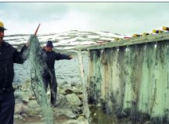
Utsetting av yngel på Kolbeintvatnet.