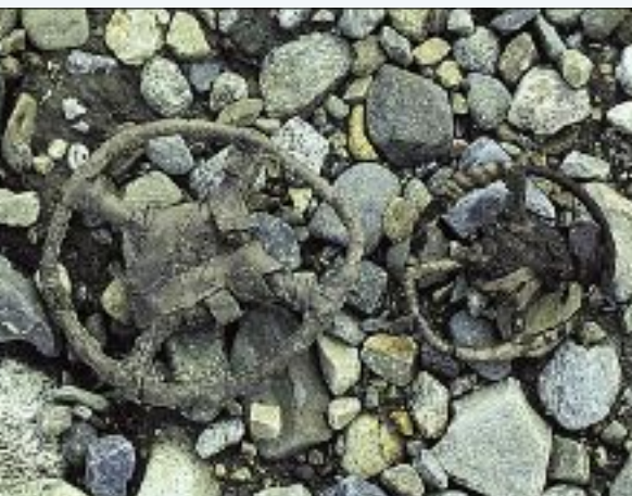
Gamle søkker funne ved Tesse.

Når ein innsjø blir nedtappa, vil det og skje ein sterk reduksjon i produksjonen av botndyr i strandsona. Her finn ein oftast dei viktigaste næringsdyra for aure. Ei regulering har vanlegvis ikkje nokon negativ verknad på dyreplanktonet ute i vatnet.