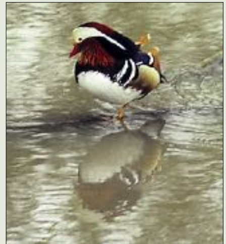
Mandarinand - ein fargerik skapning som har vore

Invasjonsartar kallar vi dei som enkelte år dukkar opp i store tal. Som regel kjem desse frå aust. I 1995 vart Sibirsk nøttekråke sett både i Nordberg og Lom i eit tal på om lag 30 og seinare utover hausten kom store flokkar med sidensvans, gråsisik og trost. I gode kongleår kjem krossnebbane nedover skogliene og startar da gjerne hekkinga