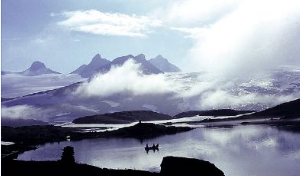
Opptaking av garn på Fantesteinvatnet

Det er fjellstyra som forvaltar fisket og sel fiskekort i statsallmenningane. Lom fjellstyre selde siste året 943 fiskekort, som gav ei bruttoinntekt på kr 75 000.