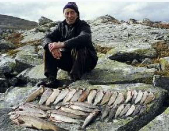
Fiskehenting i Botn.

Lom og Skjåk har store ressursar av vatn og elver for fritidsfiske, og fiskeressursane har alltid hatt mykje å seie for bygdafolket. I eldre tider hadde fisket stor verdi som matauk, og for nokre også som næring. Aure er den mest utbreidde fiskearten i landet. Frå steinalderen og fram til vår tid har folk spreidd den til vatn og vassdrag.