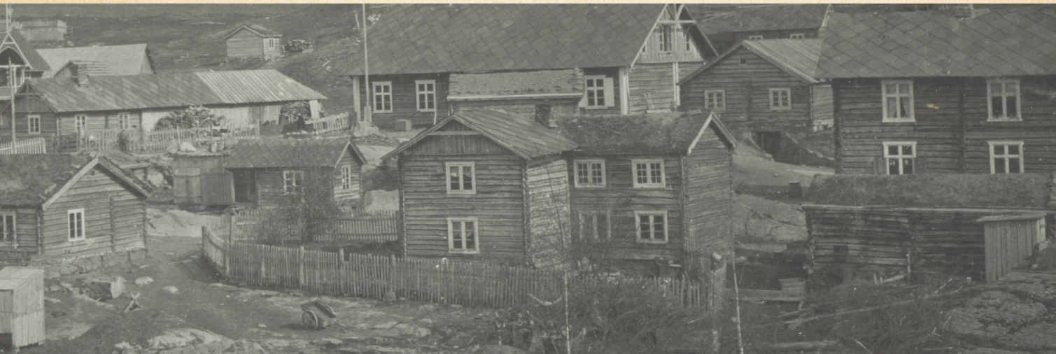
huset og brukte det til ymse føremål. Bygget fremst i midten er Søre Fosstugu, som var ein viktig samlingsstad som kafe på Bergom. Prestbrua var slik fram til ny bru kom i 1935.