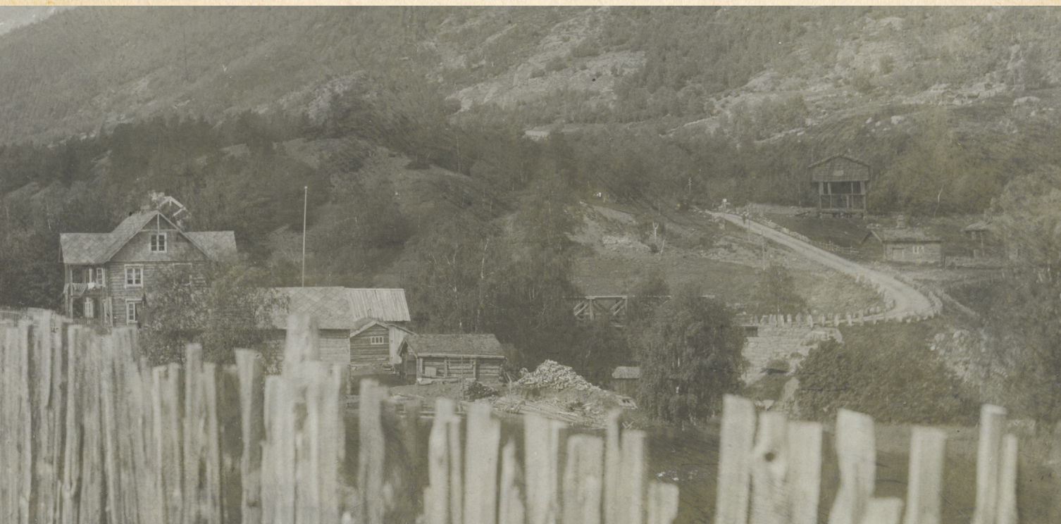
Fossberg bak Torjerbue vart bygt om i «stasjonsstil» før 1905, om lag samtidig med at hovudbygninga på Nordal vart oppført. Brubakken hadde ingen avstikkar mot Skjåk før litt lenger opp der veggen tok av mot det som nå er «Gammelvegen».