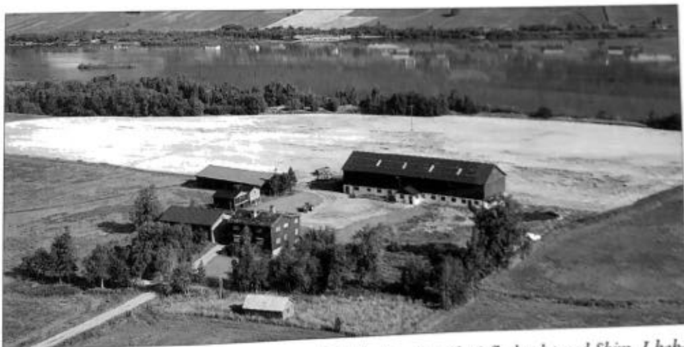
Sy gard Gjeilo, ein av dei største gardane i Skjåk, ligg fint til på flatlandet ved Skim. I bakgrunnen Ramstadstrond. Garden er nå ått av Ola G. Gjeilo, barnebarn til tidlegare ordførar Ola F. Gjeilo.