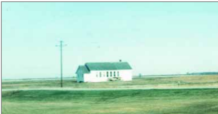
Samfunnet i Adler Township var godt utstyrt med skular. Området hadde heile tre skular. Den fyrste starta opp undervisning alt i 1882. Her Adler School no. 2 som dei fleste lomsætta sokna til.

Kyrkja var sentral i kvardagen i Adler Township. I tillegg til gudstenestene var det eit omfattande organisasjonsliv med utgangspunkt i kyrkja.