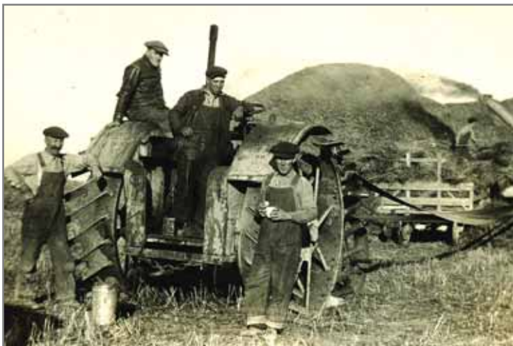
Tresking på ein farm i Adler Township i 20-åra.