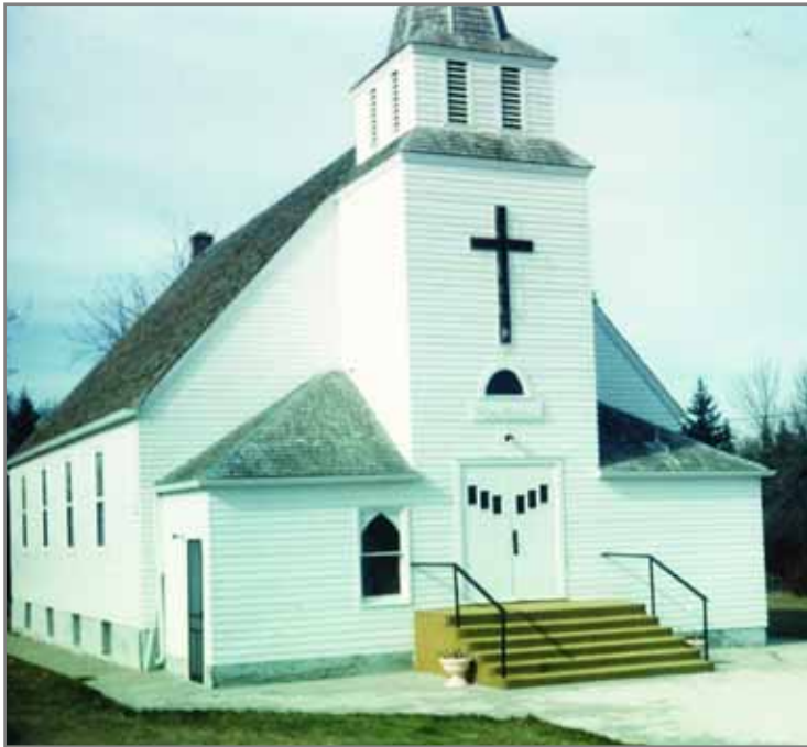
Lom Lutheran Church.